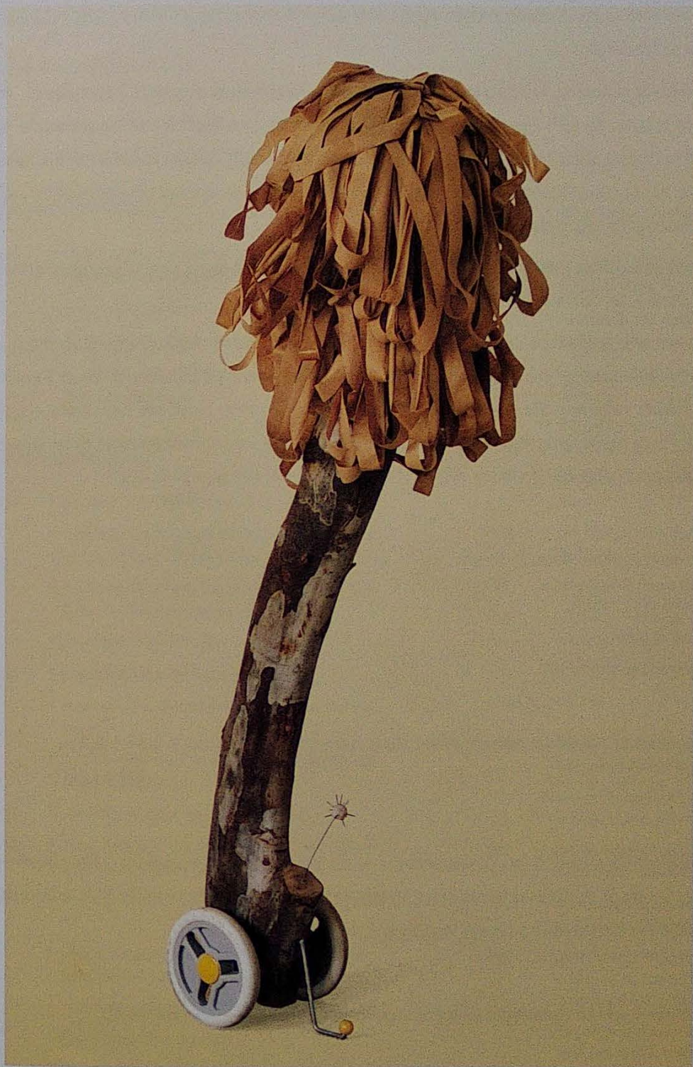
«OASIS». 1991. Instalación (detalle).